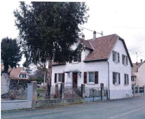
DP7 environnement proche :