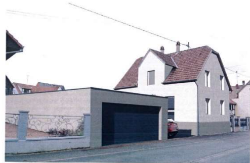
DP 6 Document graphique APRES