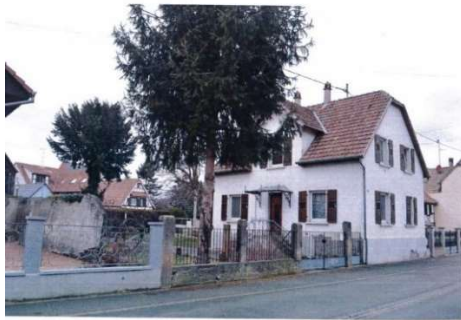
DP 6 Document graphique AVANT :