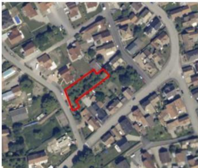
Le site concerné

Situé au centre du village, le secteur de projet d'une superficie de 0,06 hectare, correspond actuellement à un jardin.