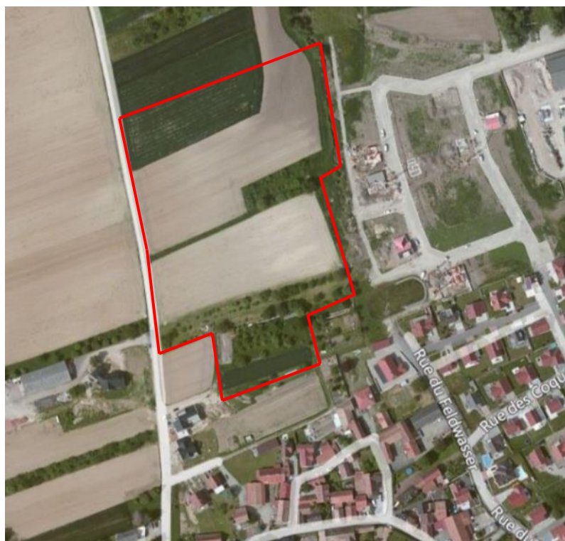
Le site concerné.

Le secteur de projet constitue le prolongement du lotissement situé à l'Est du Feldwasser. Il est délimité par un chemin d'exploitation à l'Ouest, des maisons d'habitation au Sud et le Feldwasser à l'Est.